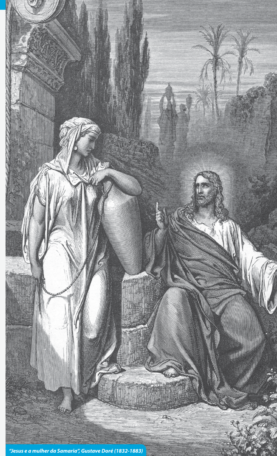
“Jesus e a mulher da Samaria”, Gustave Doré (1832-1883)

www.catedralonline.com.br Rua Nestor Pestana, 136/152 – 01303-010 São Paulo, SP – (11) 3138-1600 adm@catedralonline.com.br secretaria@catedralonline.com.br