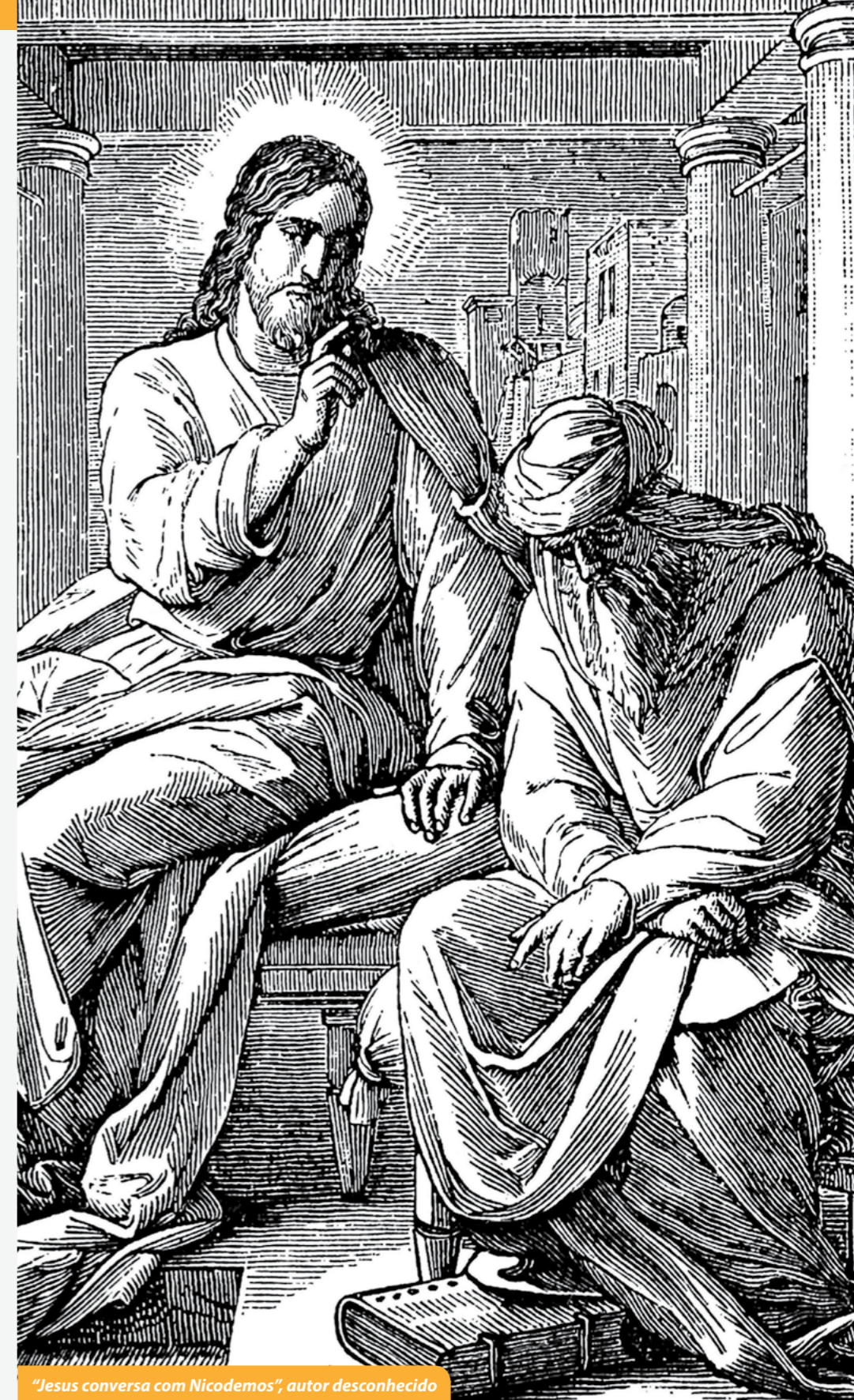
“Jesus conversa com Nicodemos”, autor desconhecido

www.catedralonline.com.br Rua Nestor Pestana, 136/152 – 01303-010 São Paulo, SP – (11) 3138-1600 adm@catedralonline.com.br secretaria@catedralonline.com.br