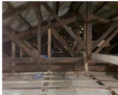
Troca das telhas em toda extensão do templo: nave principal e anexos (mezanino).

No culto do dia 02/02/25, a Primeira Igreja iniciou a campanha para obras de reforço da estrutura do telhado e do forro e troca das telhas do templo. O valor estimado da obra é R$ 540.000,00, que serão pagos parceladamente. A Primeira Igreja possui parte do valor.