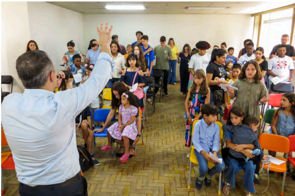
Culto de fevereiro/24.