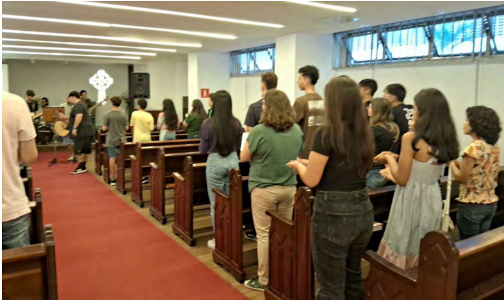
Culto de março/24.

No próximo sábado, às 16h, o MJA - Ministério de Jovens e Adolescentes realizará culto de louvor a Deus na Capela. Eles mesmos prepararão a liturgia e convidam toda a igreja para participar deste momento de adoração. Lembre-se: dia 29/6/24, 16h, na Capela. Participe!